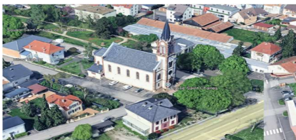
Eglise St Charles St Louis Bourgfelden 140m 2 - 30kWc

Ancienne Caserne des Pompiers St Louis Dans le cadre d'une complète rénovation y compris le toit 200m 2 - 45 kWc