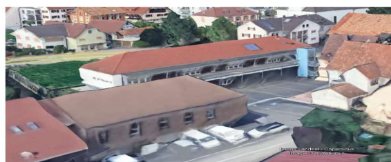
Centre Aéré - 150m 2 35kWc

Centre de Secours Pompiers - 110m 2 25 kWc