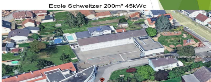
Ecole Schweitzer 200m 2 45kWc

La loi APER (loi d'Accélération des Energies Renouvelables) qui impose, à partir du 1 er juillet 2028, de couvrir les parkings de plus de 1500m 2 avec des ombrières intégrant des panneaux photovoltaïques.