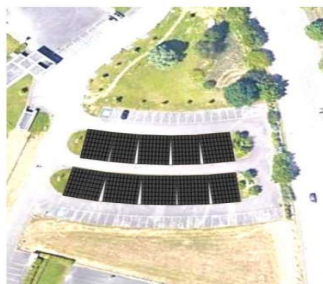
Parking RIVERHIN Ombrières 274 kWc